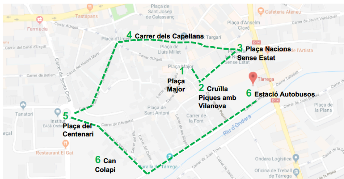
Mapa del recorregut de la Marxa Exploratòria per Tàrraga

Durant el recorregut s'analitzen els diferents aspectes que condicionen la percepció de seguretat. Els elements més comuns que surten i que més condicionen la percepció de