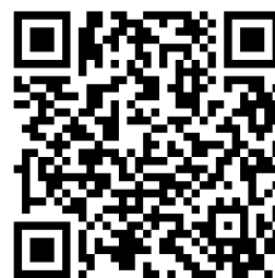
Las gafas violetas revista: mapa de feminicidios

2. Feminicidis en els quals les dones actuen pels seus propis motius: Assassinats per gelosia, per exemple, dones que maten l'amant de la seva parella.