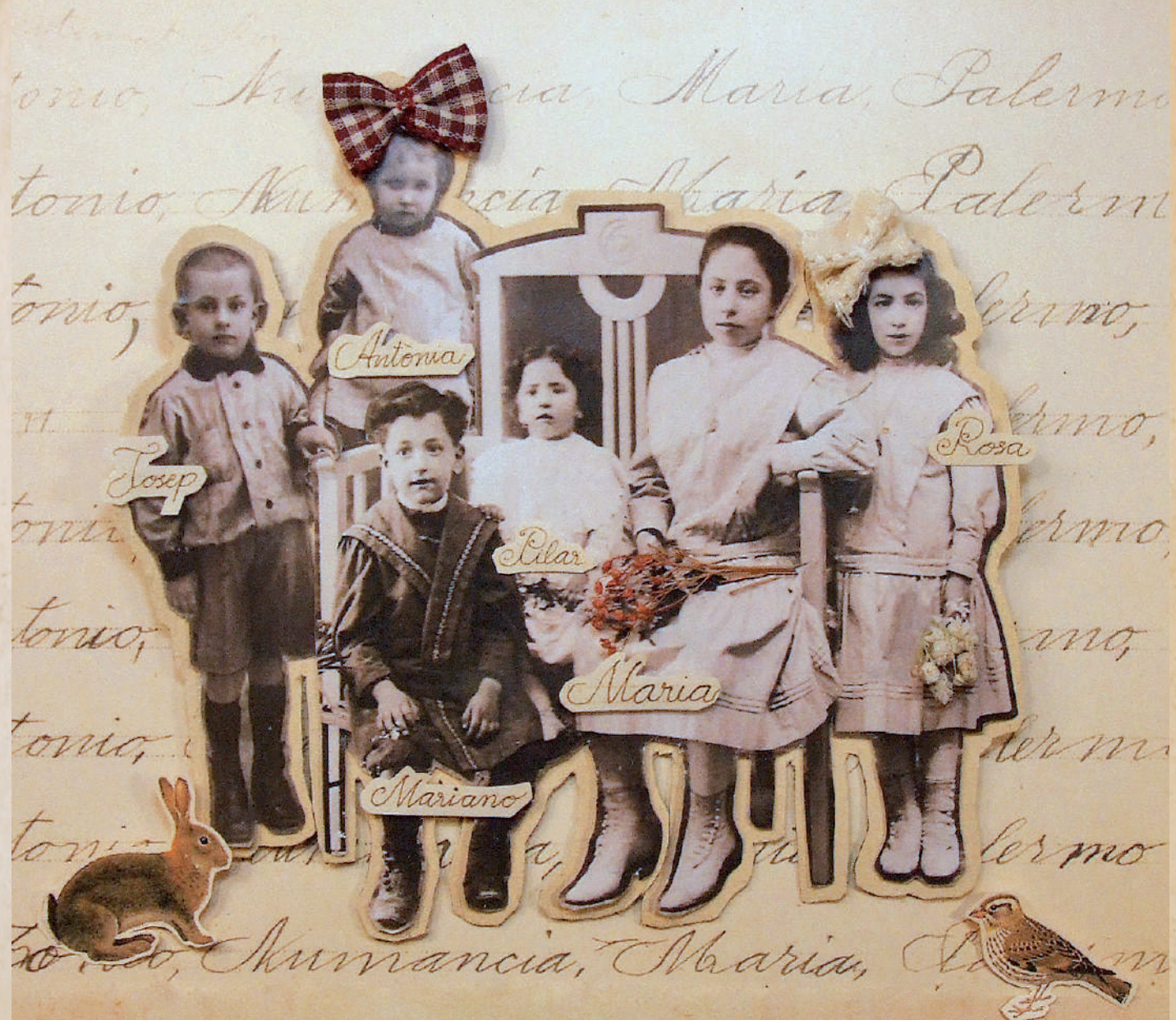
Compárese la primera página con la última, y véase si se adelanta.