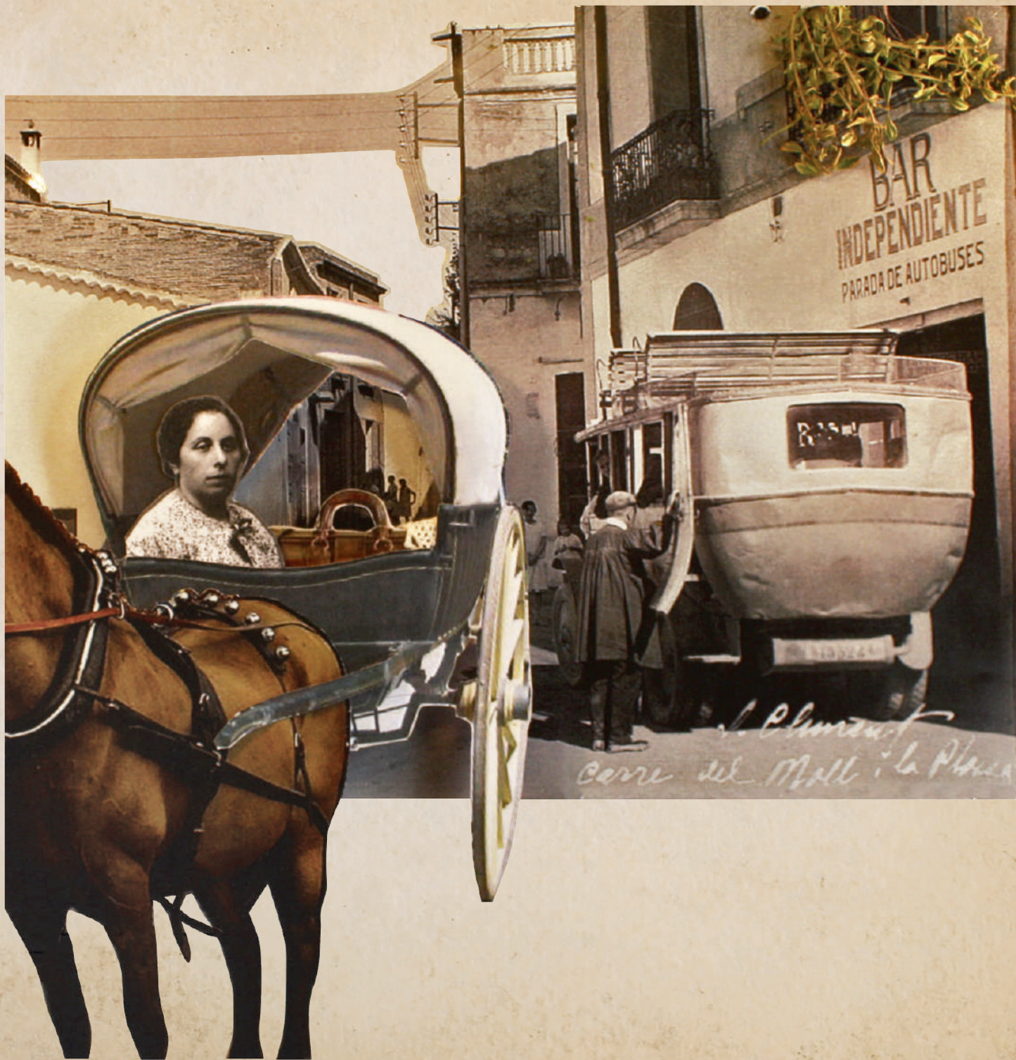
J. Clément Corre del Mall i la Plaça